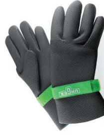
NEOPREN HANDSCHUHE GLOV1, GLOV2, GLOV3, GLOV4

Wickeln Sie zum Messen diese Seite um Ihre Hand!