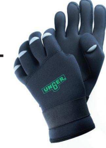
ErgoTec® NEOPREN HANDSCHUHE GLO2S, GLO2L, GLO2X, GLO2Z

Diese Größeninformation bezieht sich auf die NEUEN Unger Neopren und ErgoTec® Neopren Handschuhe.